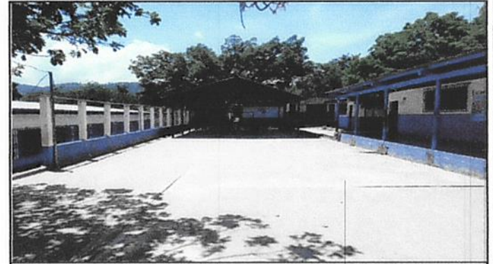
Foto 4: Se necesita techar esta área porque así como el Sol se recibe muy fuerte, también se ve afectada por las fuertes lluvias de la tempora lluviosa.