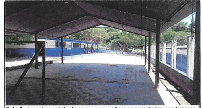
Foto 6: La galera existente es muy pequeña y no cumple las condiciones necesarias para que los estudiantes realicen sus actividades de enseñanza aprendizaje.

Observación: Si es necesario se pueden agregar hojas adicionales y actualizar el número de hojas.