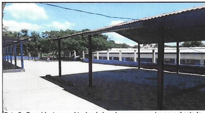
Foto 5: Es evidente que el techo de la galera se encuentra en mal estado debido al deterioro por corrosión.