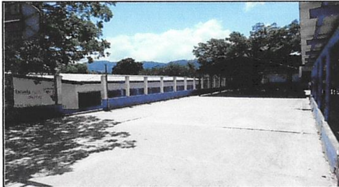
Foto 3: Se puede observar en esta imagen qu el Sol se recibe muy fuerte en la mayor parte del día, porque no se cuenta con árboles cerca para que proporcionen sombra.