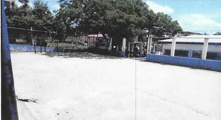
Foto 1: Sepuede observar la necesidad de la ampliación de galera de la cancha deportiva del centro educativo, para cubrir a los estudiantes de lo fuerte que se recibe el sol en esta área.